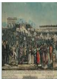
La première fête du 14 juillet en 1790